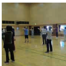
まずは、ストレッチから